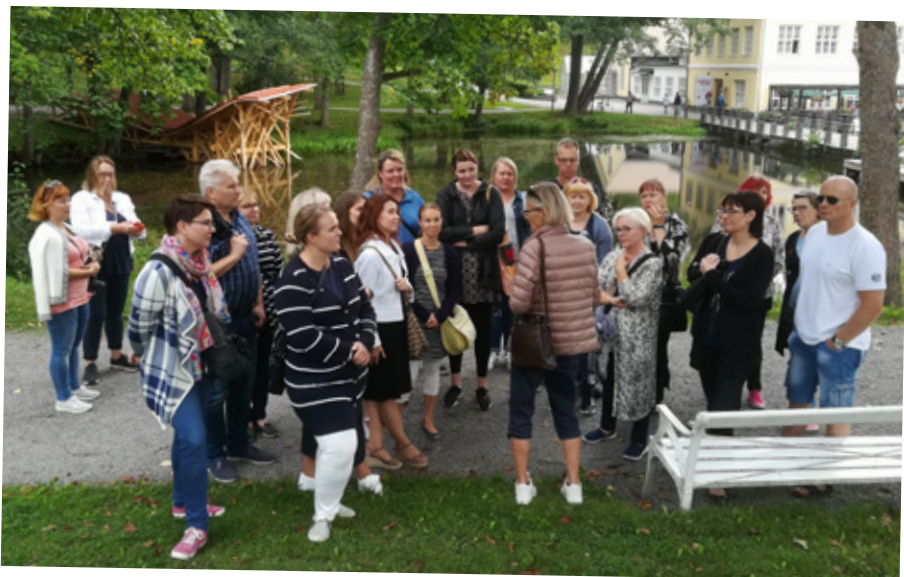
Fiskarsissa oli mahdollista osallistua oppaan johdolla kierrokselle tutustumaan Fiskarsin historiaan