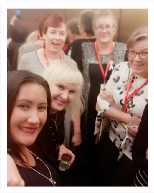
Happoradio kutsui meidän porukan all female -paneelia

Taas tuli todistettua, että supersuosittu Pirkanmaan alueen yhdistysten pikkujouluristeily on paikkansa ansainnut yhteisissä tapahtumissamme. Jo toista kertaa vietetyissä, perinteisissä pikkujouluissa oli mukana reippaat neljäkymmentä juhlijaa TreSProsta, ja kaiken kaikkiaan busseja Turkuun lähti viisi.