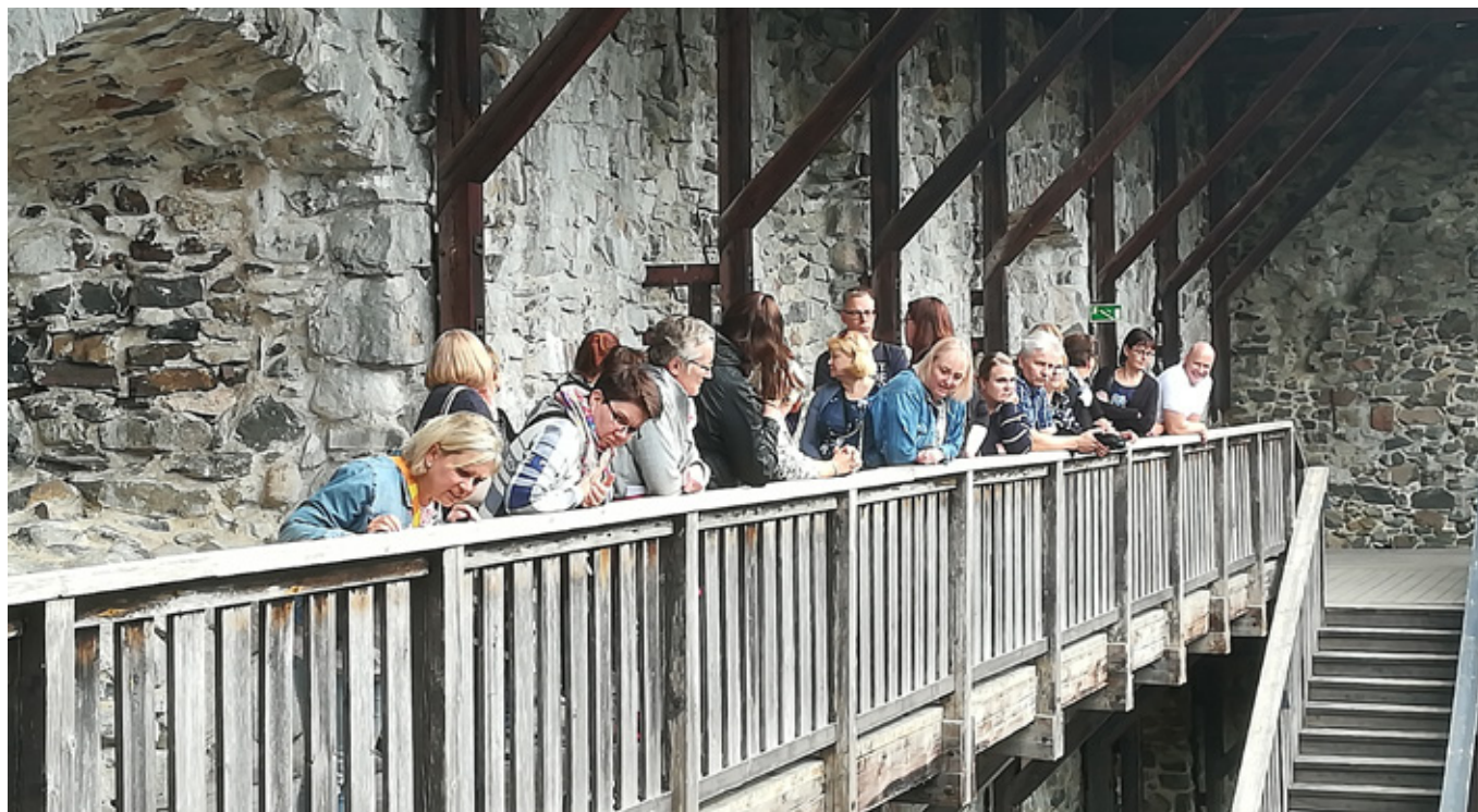
Innokkaita retkeilijöitä linnan raunioita tutkimassa.

kennuksiakin nousee Fiskarsin alueelle tasaiseen tahtiin.