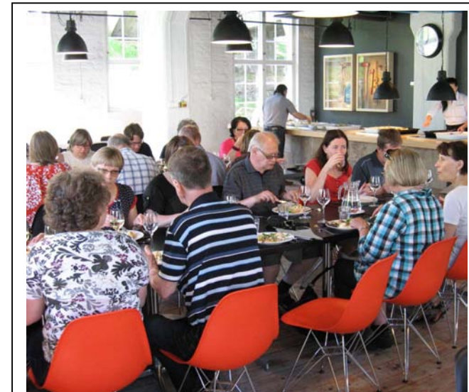
Billnäsin ravintolassa nautittiin myös matkan hintaan kuulunut maittava lounas