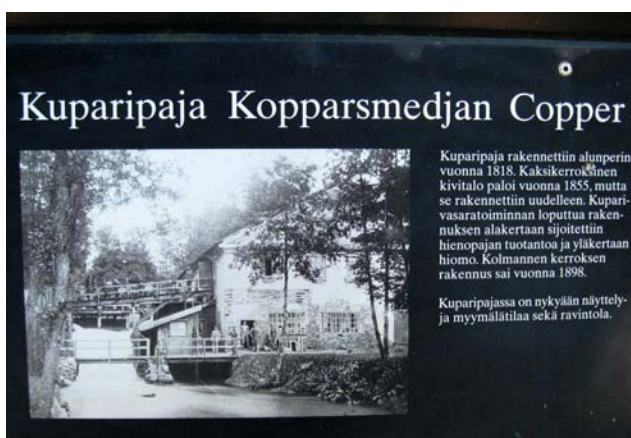
Kuparipajassa Fiskarsissa tehtiin ennen mm. kuparisia kahvipannuja