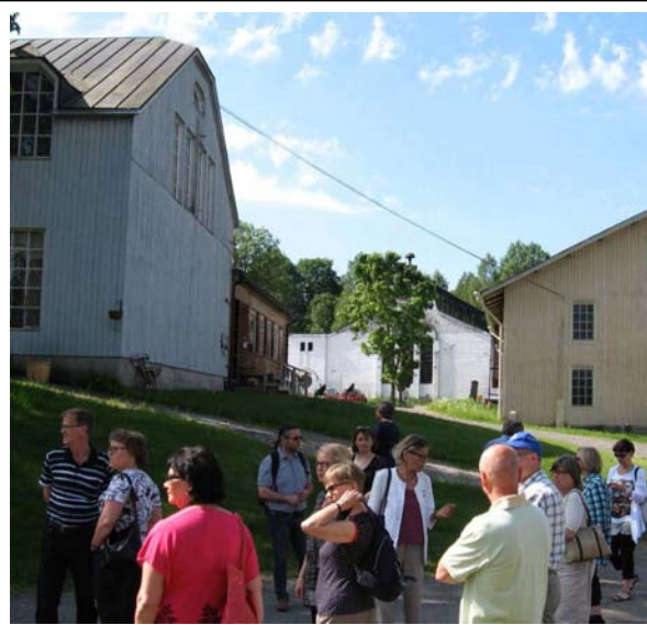
Ruukkialueella oli paljon vanhoja rakennuksia