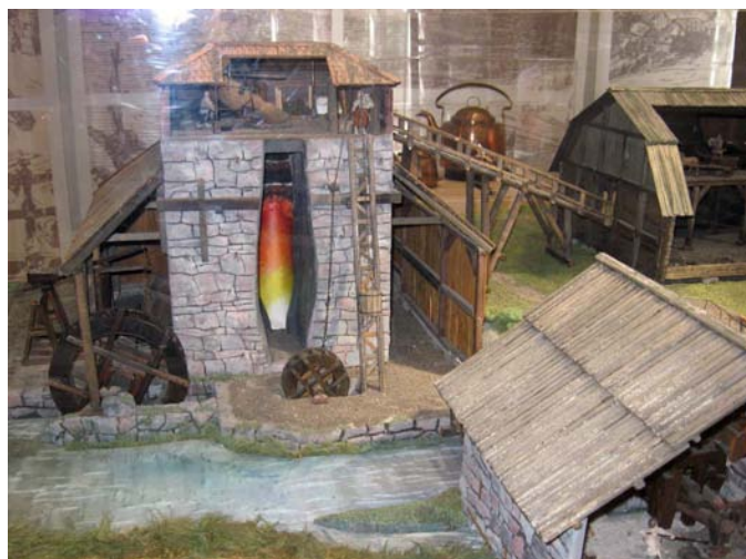
Näyttelytiloissa kerrotaan ruukin toiminnasta havainnollisesti