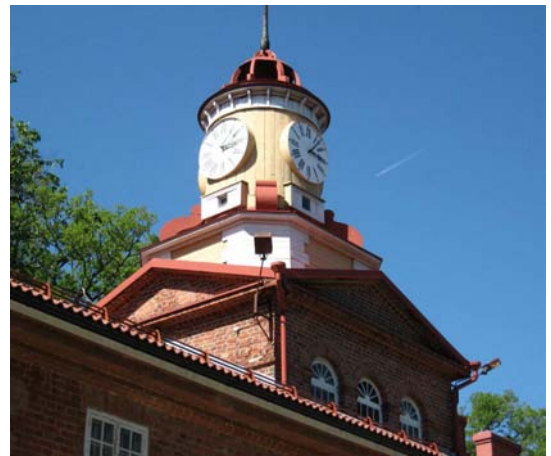
Kellotorni on Fiskarsin ruukin tunnus. Tornissa on aito Könnin kello no 9, rakennettu 1842