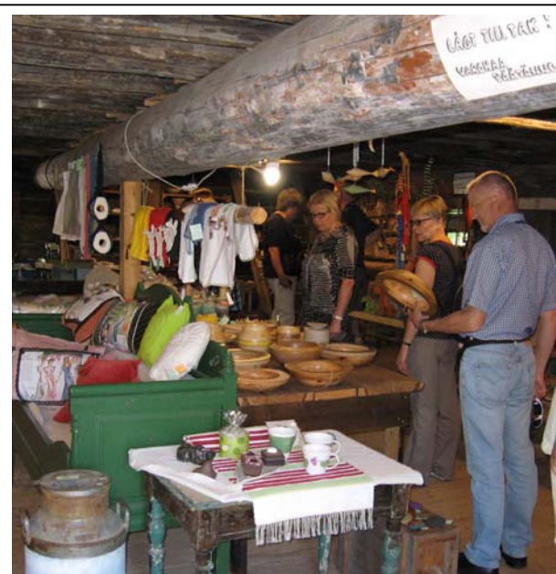
. . . ja sisältä myös