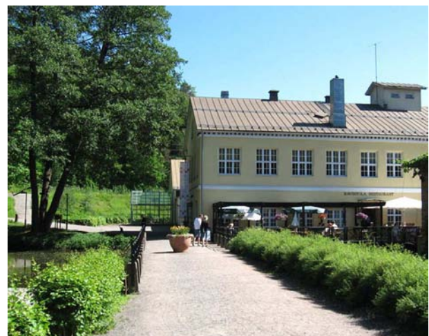
Kuparipajan rakennuksissa on nykyään näyttelytiloja, myymälä ja ravintola