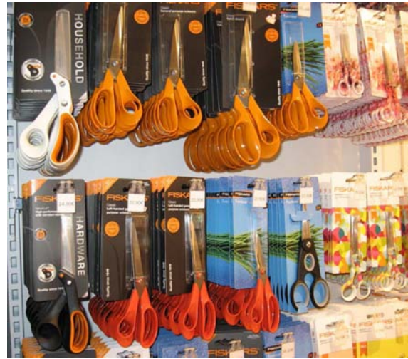
Nykyään Fiskarsin myydyin tuote on sakset. Niitä on myyty maailmalla jo melkein miljardi kappaletta