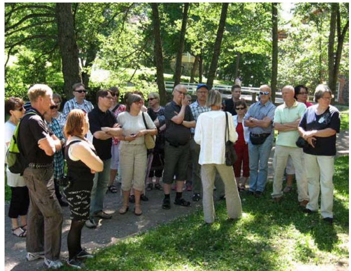
Fiskarsin kylä on kesällä vihreää puistoa