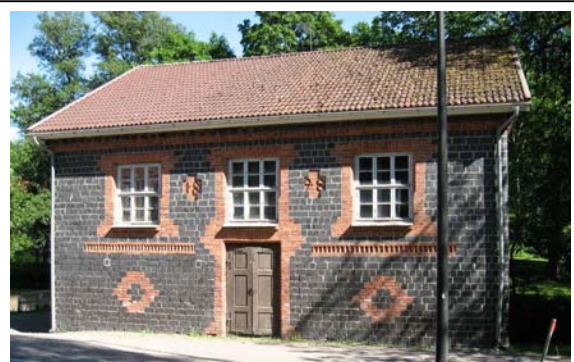
Myllyrakennus kylätien varrella