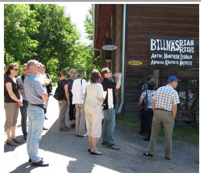
Vanha riihi oli mielenkiintoinen ulkoa . . .