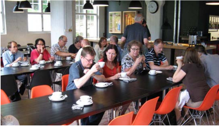
Billnäsin esittely aloitettiin kahvitarjoilulla