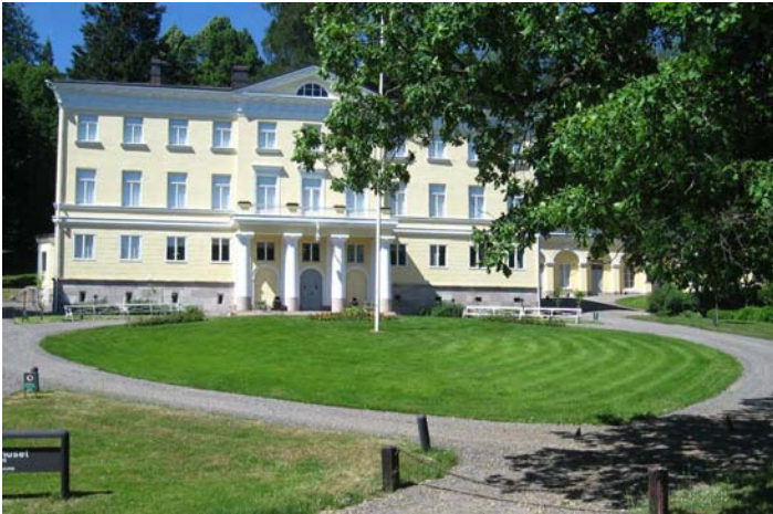
Fiskarsin ruukkikylän Stenhuset on kylän päärakennus. Se on ollut ruukin omistajan asuntona, rakennettu 1822