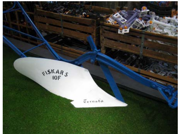
Aura no 10 oli Fiskarsin myydyin tuote entisaikaan, kun hevosvetoisia työvälineitä tehtiin paljon