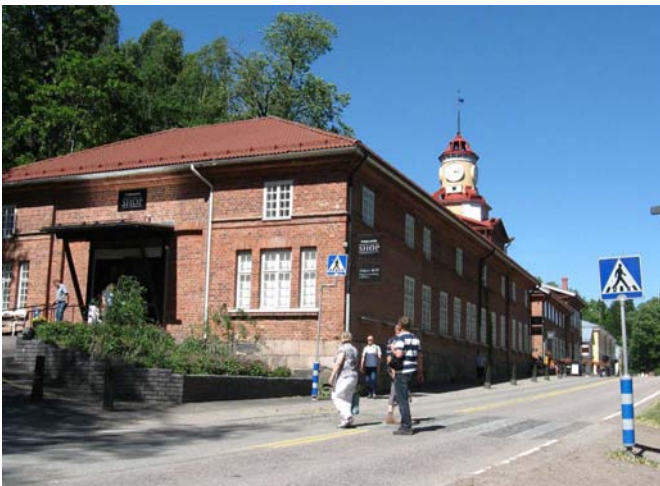
Kellotornirakennuksessa on myymälöitä, näyttely ja kahvila