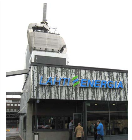
Sisäänkäynti vieraille oli tästä