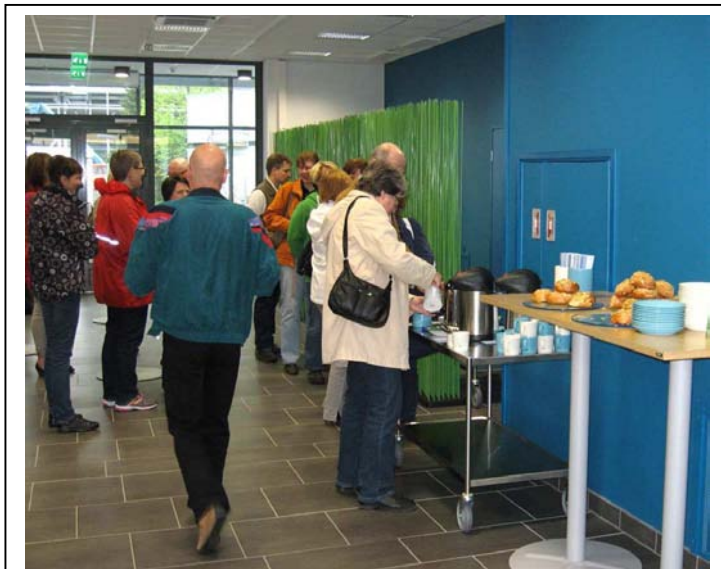
Kahvitarjoilulla aloitettiin . . .