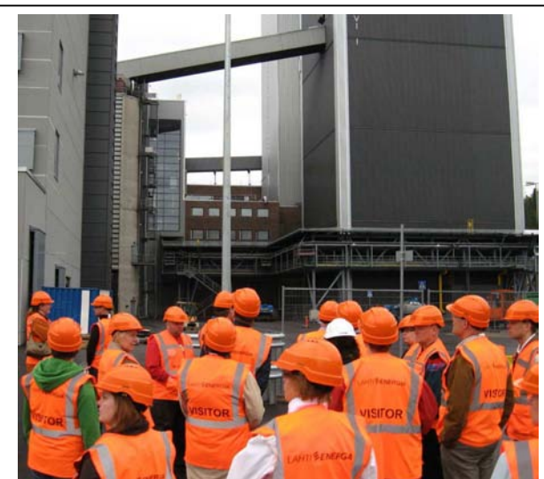
Voimalakierroksella oli paljon nähtävää. Sisätiloissa ei saanut kuvata.