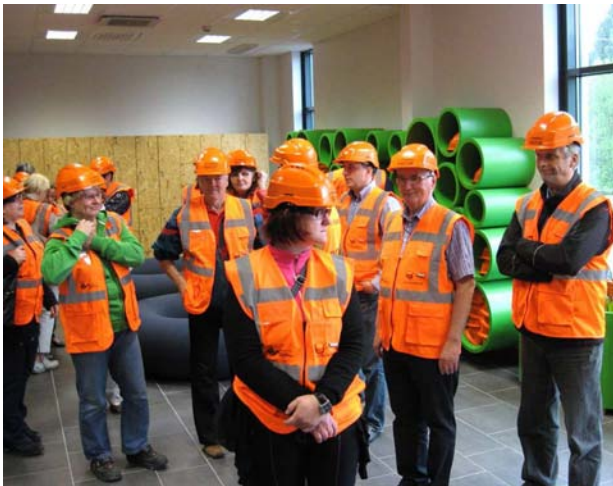
Voimalakierrokselle saatiin punaiset kypärät ja liivit