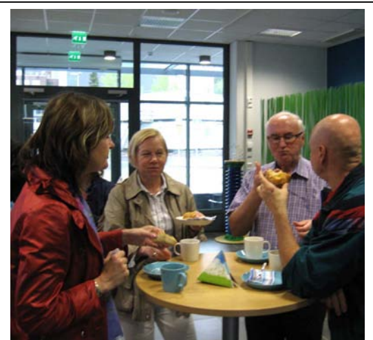
Kahvi ja pulla maistui . . .