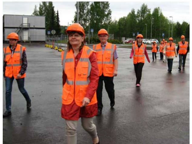
Punainen joukko menossa kierrokselle