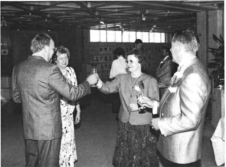
Kuvassa yhdistyksen edustajat Lahden Tekniset r.y:n vieraina

Yhdistyksemme on osallistunut aktiivisesti suurten yhdistysten kokouksiin pyrkien vaikuttamaan jäsenistönsä edunvalvontaan ja hyvinvointiin liittyviin kysymyksiin.