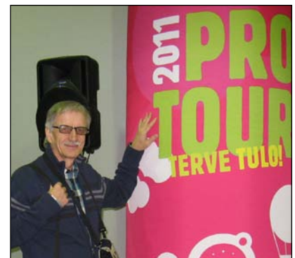
Teksti ja Kuvat Seppo Heikkinen