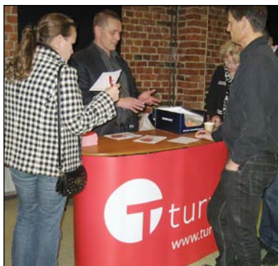
Vakuutus Turva oli paikalla