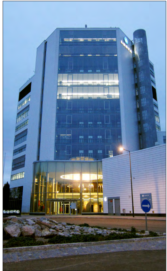
Luhdan pääkonttori hämärtyvässä illassa