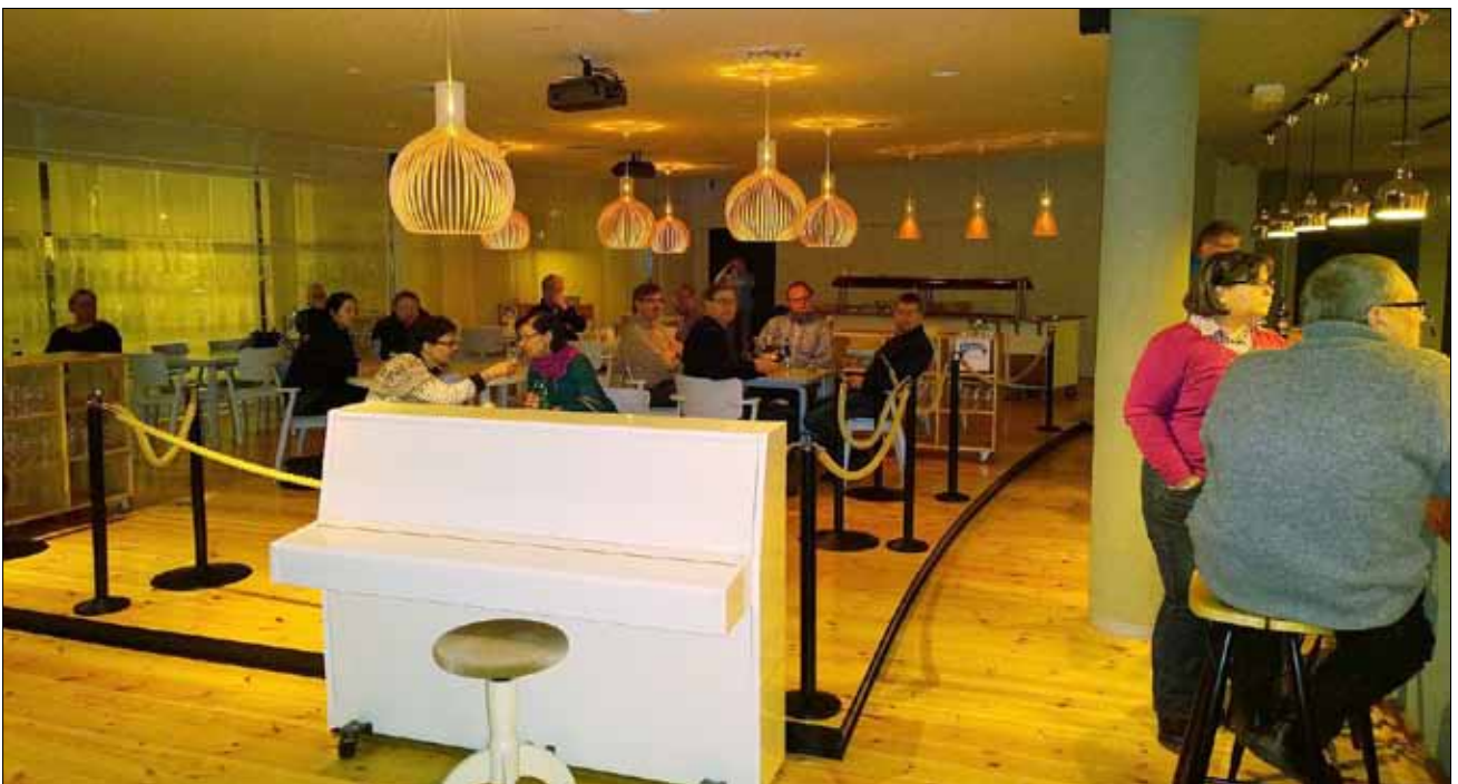
Tunnelma paikallaan Hartwallin edustustiloissa.