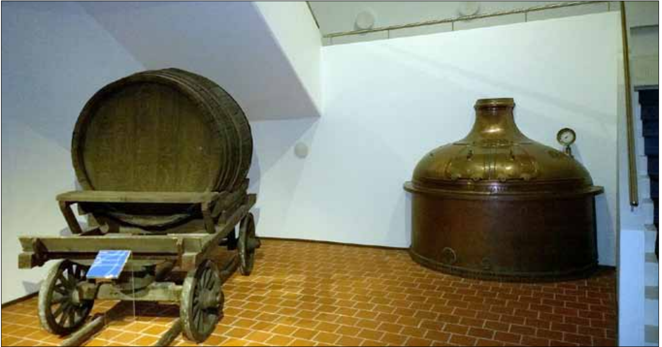
Oluenpanon historiaakin oli päässyt Hartwallin uusiin tiloihin.

osaaminen on ”IN”. Kesätyöntekijöitä otetaan töihin ja heidät opastetaan työpiste kerrallaan töihin.