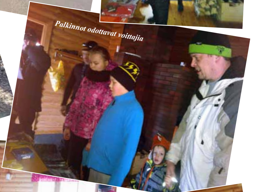
Palkinnot odottavat voittajia