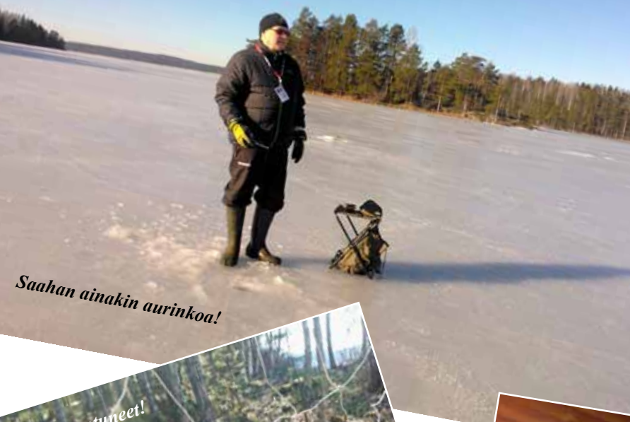
Saahan ainakin aurinkoa!