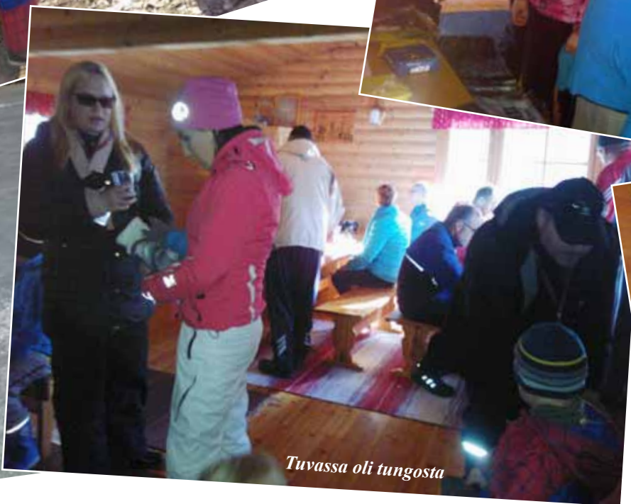
Tuvassa oli tungosta