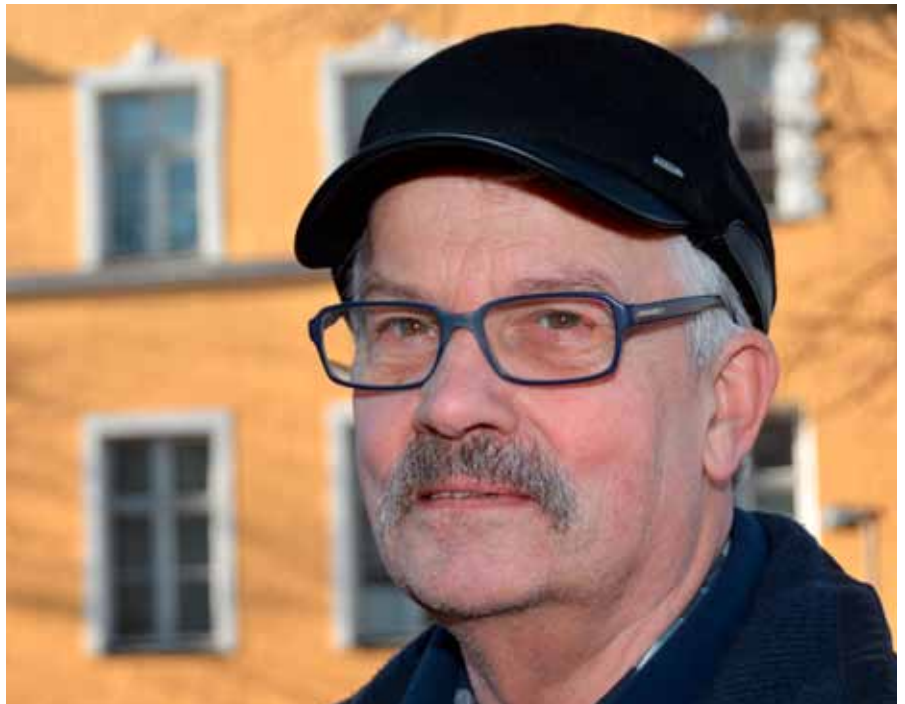
Bobi on mukana monessa, kenelläpä olisi enemmän mielenkiintoa yhdistysten historiaankin. – Kiitos avusta juhlaulkaisun aineiston keräämisessä!