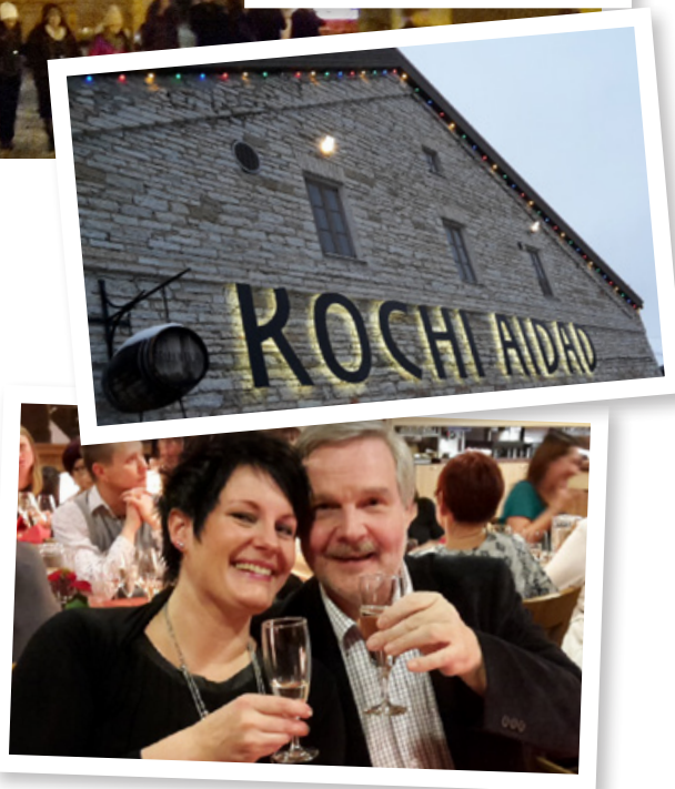
Ylin kuva: Joulutorilla myytiin erilaisia lämpimiä juomia, tässä minttuiset kaakaot testissä.

Vuonna 2015 pikkujoulureissua ei yhdistyksen 90-vuotisjuhlavuoden 24.10. päätapahtuman vuoksi järjestetä, mutta pitäkäähän seuraavaa vuotta 2016 silmällä - mihinkäs sitten lähdetäisiin?