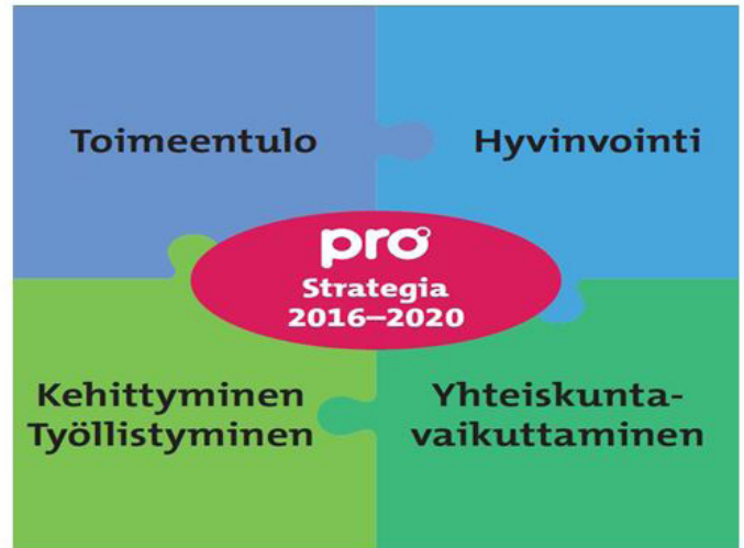
▲ Pron strategian kulmakivet, Vuorio esitteli strategiassa mainittuja keinoja päämäärien saavuttamiseksi.

▼ 67 Prolaista kokoontui Tampereen Puistotorniin marraskuussa.