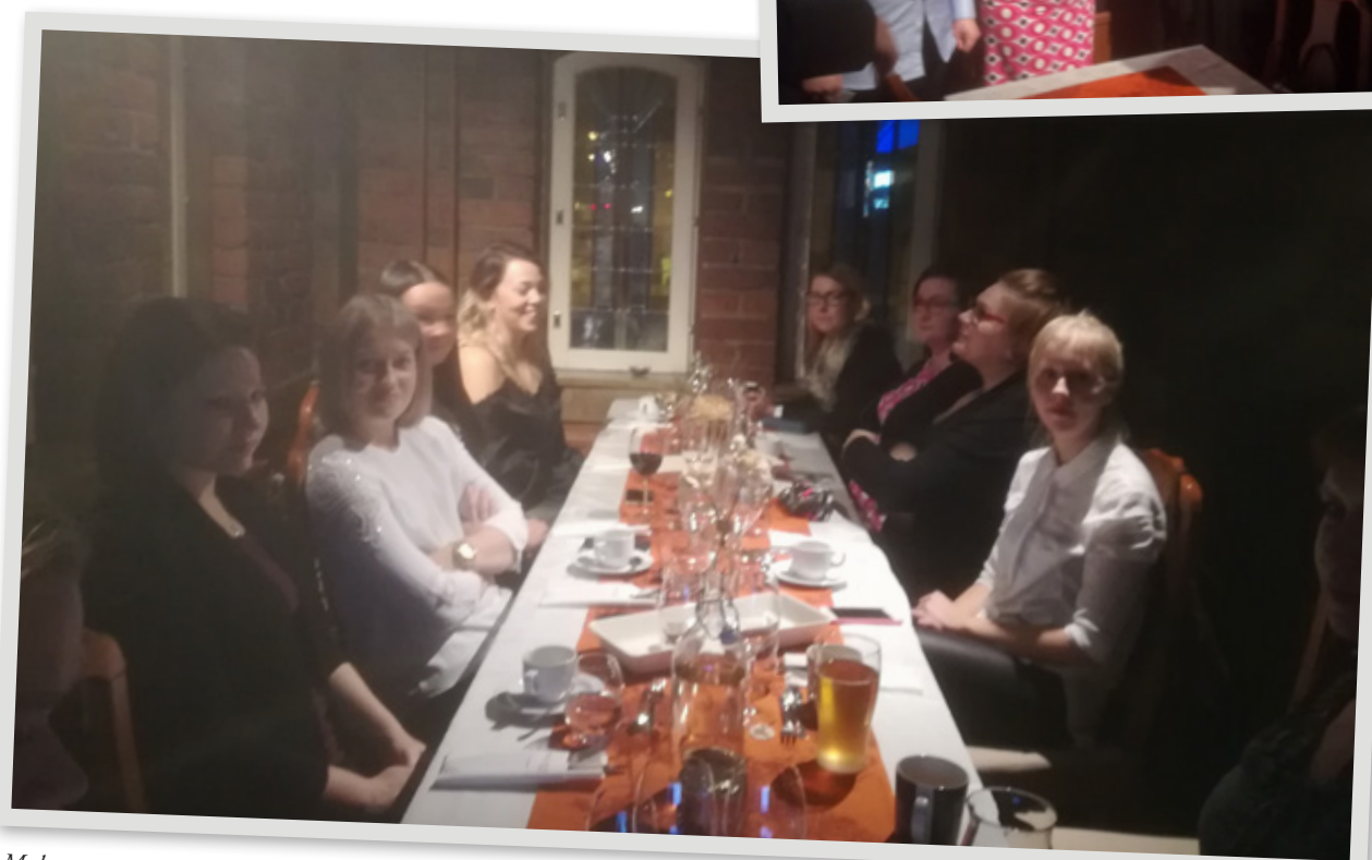
Mukana menossa Lapin kultakuumeessa ja -huumassa

M urhamysteeri-illallinen jäsenistömme nuoremmalle porukalle pidettiin marraskuun alkupuolella Ravintola Mylläreissä. Ilta alkoi jäseneduista kertovalla videolla, ja jatkui tarinan taustoituksella vetäjien puolelta. Murhamysteeri oli hauskaa, rentoa ja elämyksellistä menoa, jossa heittäydymme murhailan pyörteisiin kukin omine hahmoinemme. Hetkeksi Myllärit muuttuivat Luoston Eevert Kivekkään juhlapaikaksi, mukana me-