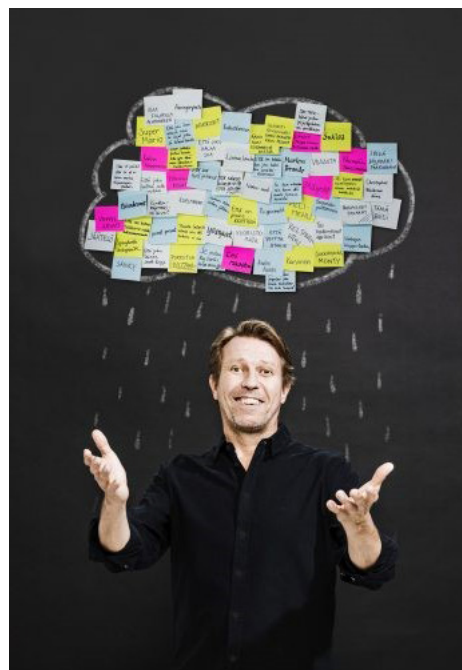
Kuva: Otto-Ville Väätäinen

Julkaisija: Heto Pro ry Hämeentie 14, 00530 Helsinki