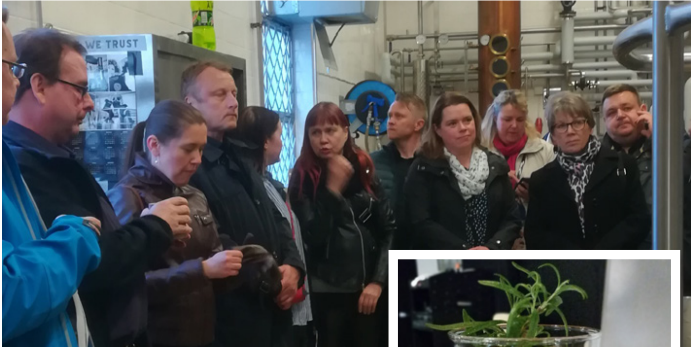
Tislaamokierroksella pannuja ihmettelemässä.