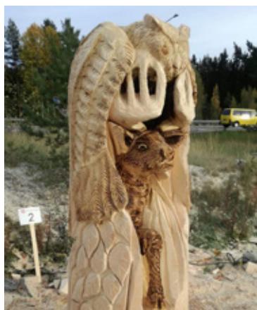
Tällä teoksella voittiin SM 2018