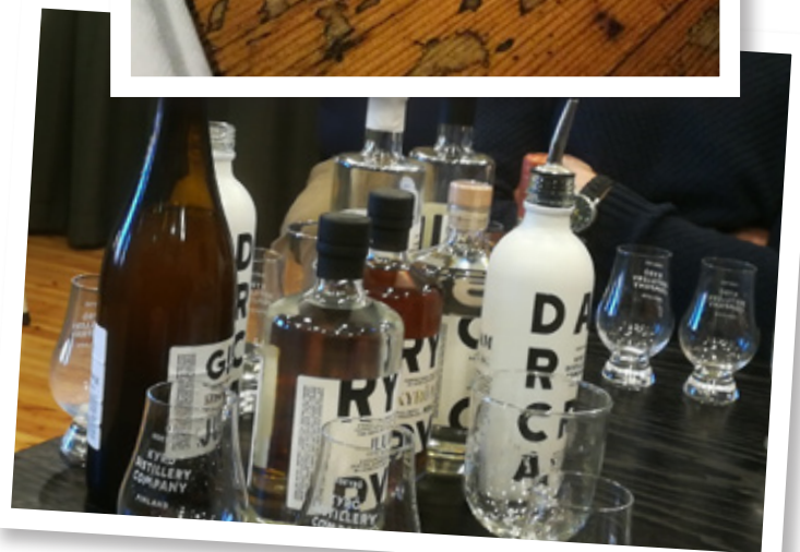
Kierroksen päätteeksi maisteltiin.