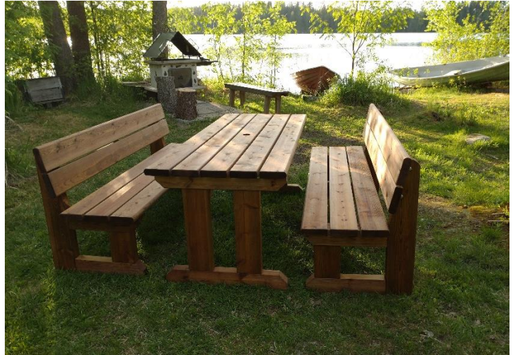
Nastolan majan uudet pihakalusteet. Kyllä kelpaa istua ja nauttia kesästä 😊