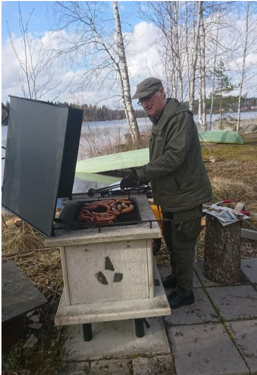
Talkooporukalle tarjolla aina myös talkooeväät